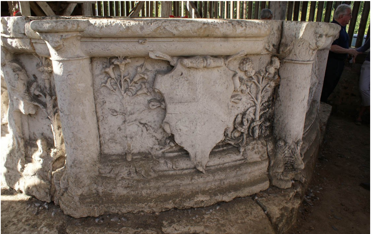
Photographie du monument historique